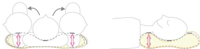
横向き 仰向け 横向き 常にまっすぐ首をささえるための高さを実現