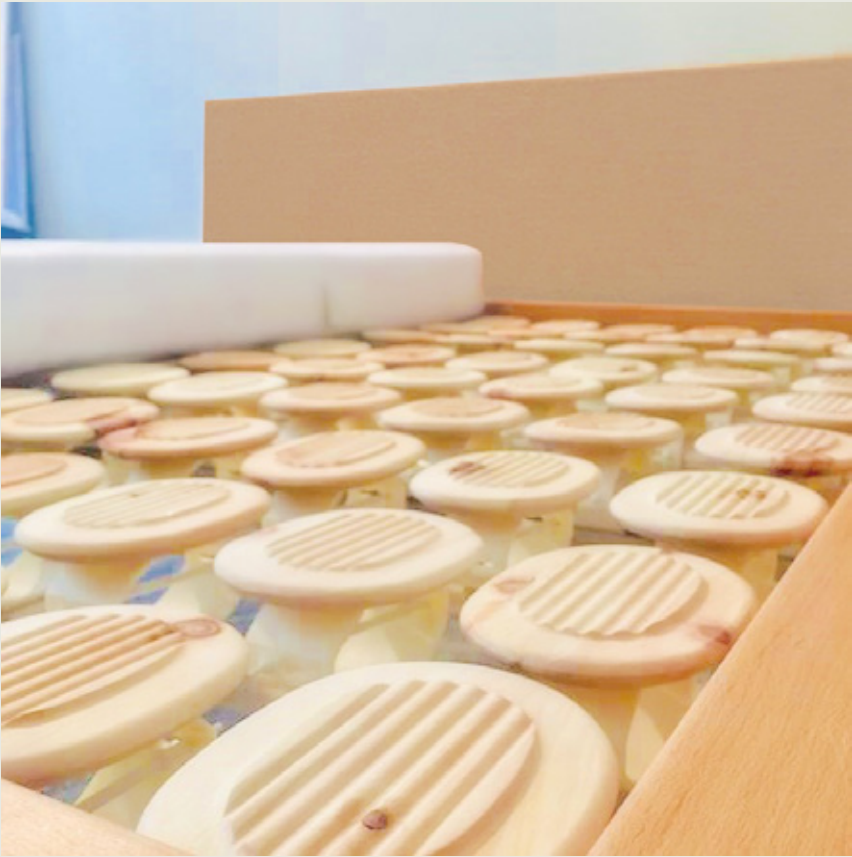
地球上の生命体が持っている健全な振動