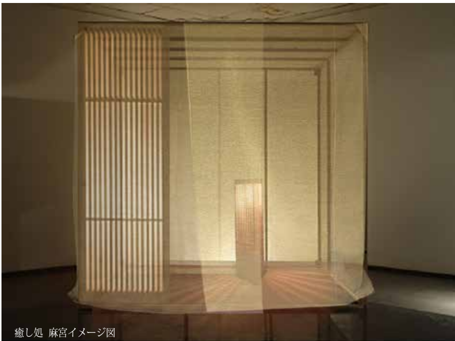
癒し処 麻宮イメージ図